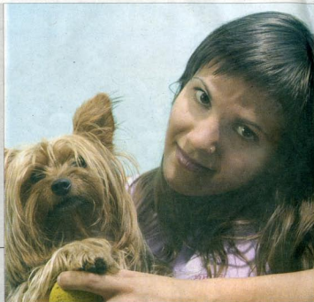
La joven empresaria posa con su perrita Lola.

“Son mucho más fotogénicos los animales que las personas”